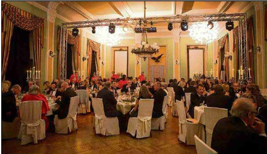
Jubiläums-Dîner bei Kerzenlicht und Chorgesang im historischen Saal des «Saratz».